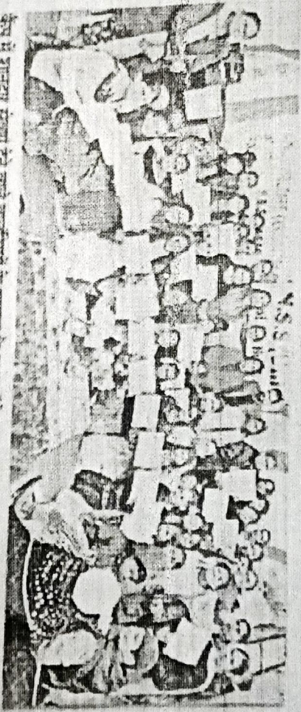
कैंप में शामिल संख्या देखे जाते वनवर्कियों के सम्मान के बाद सही से पालन सहेय्य व नवांशहर।

राज्य कैम्पेनजारा में वीएलएचम गर्ल्स कॉलेज के एनएसएस यूनिट द्वारा नवांशहर गांव के विद्यार्थियों के साथ गांव में व नशे के खिलाफ जागरूकता रैली निकाली गई, दूसरे दिन स्वच्छता अभियान चलाने हुए गांव के निवासी स्कूल व नशे के खिलाफ जागरूकता रैली निकाली गई।